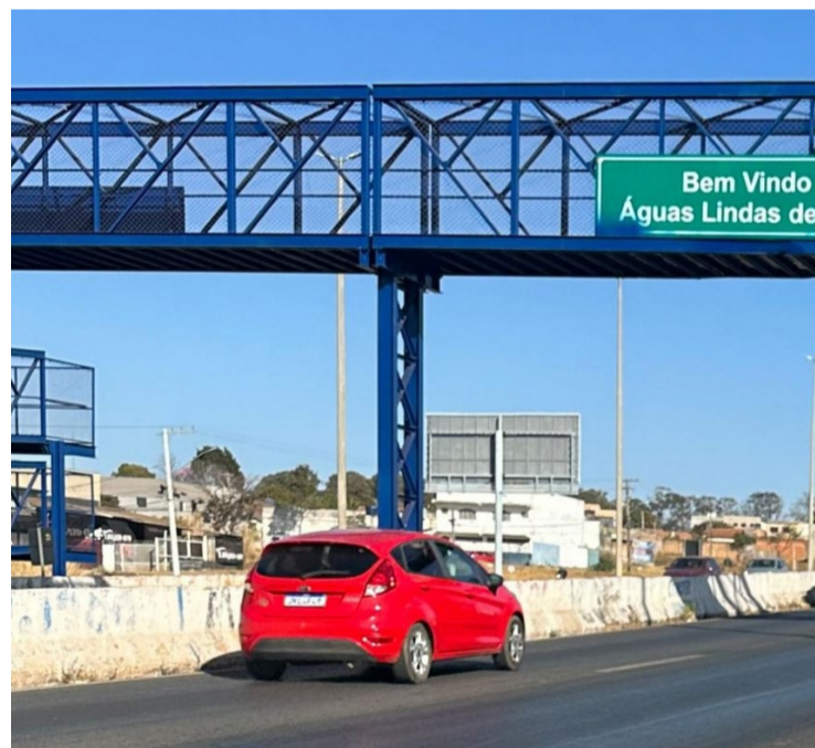
BRT de Águas Lindas pode transformar a mobilidade no Entorno do DF

O trajeto previsto é de 35 quilômetros, ligando o Terminal Águas Lindas ao Terminal Rodoviário de Ceilândia, com integração aos sistemas de transporte de Brasília. Os recursos serão inicialmente aplicados na atualização do estudo preliminar e do anteprojeto, com conclusão prevista em até 12 meses. Após essa fase, o estudo será apresentado para inclusão da execução da obra no PAC.