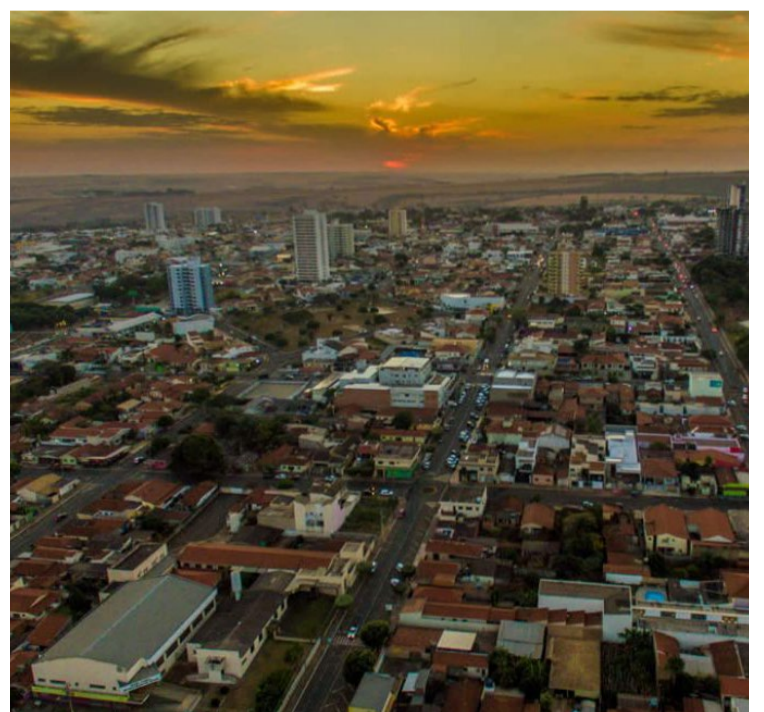
Previsão do CIMEHGO alerta para baixa umidade e risco de incêndios e agosto deve começar com sol predominante e temperaturas elevadas em Jataí e outras cidades da região — Foto: Reprodução.

O boletim também alerta para o risco de incêndios em diversas regiões do estado. A maioria das queimadas é provocada por ações humanas, e é essencial a conscientização ambiental para prevenir incêndios, que podem causar danos significativos tanto em áreas urbanas quanto rurais.