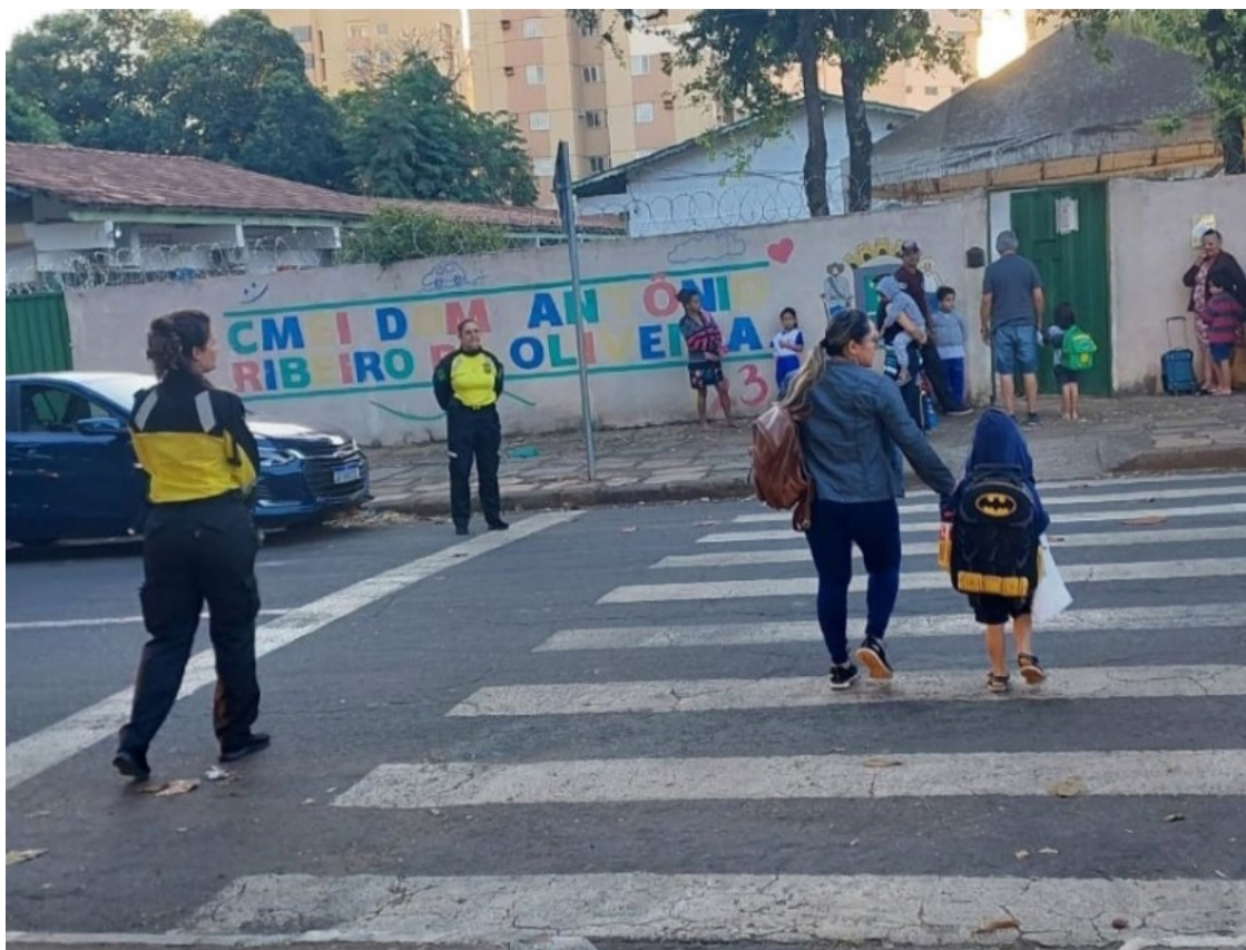
Agentes de trânsito realizam Operação Volta às Aulas com orientações durante agosto

Uso de celular, estacionar em fila dupla, parar a mais de um metro da guia do meio-fio, estacionar ou parar sobre passeio, desrespeito à placa de proibição de estacionamento, estacionar ou parar em esquina, desrespeito à faixa de pedestres, uso correto da cadeirinha ou assento de elevação para transporte de crianças, uso do capacete para transporte de crianças à partir de 10 anos e uso do cinto de segurança do condutor e passageiros estão dentre as condutas mais fiscalizadas na frente das escolas.