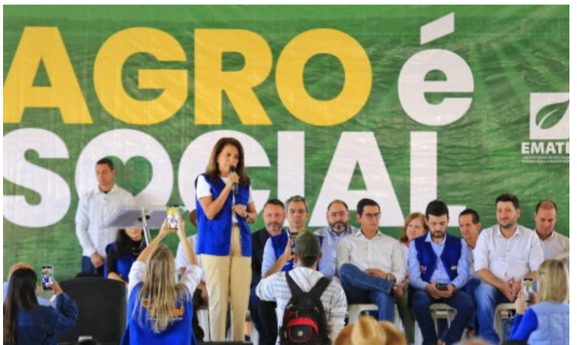
Coordenadora do Goiás Social, primeira-dama Gracinha Caiado entregou benefícios à população no último dia do Agro é Social em Itaberaí

Baseado em Itaberaí, a sexta edição do Agro é Social está levando os serviços estaduais às populações pelo menos 19 municípios. A iniciativa conta com a parceria da Emater Goiás, Secretarias de Estado de Agricul-