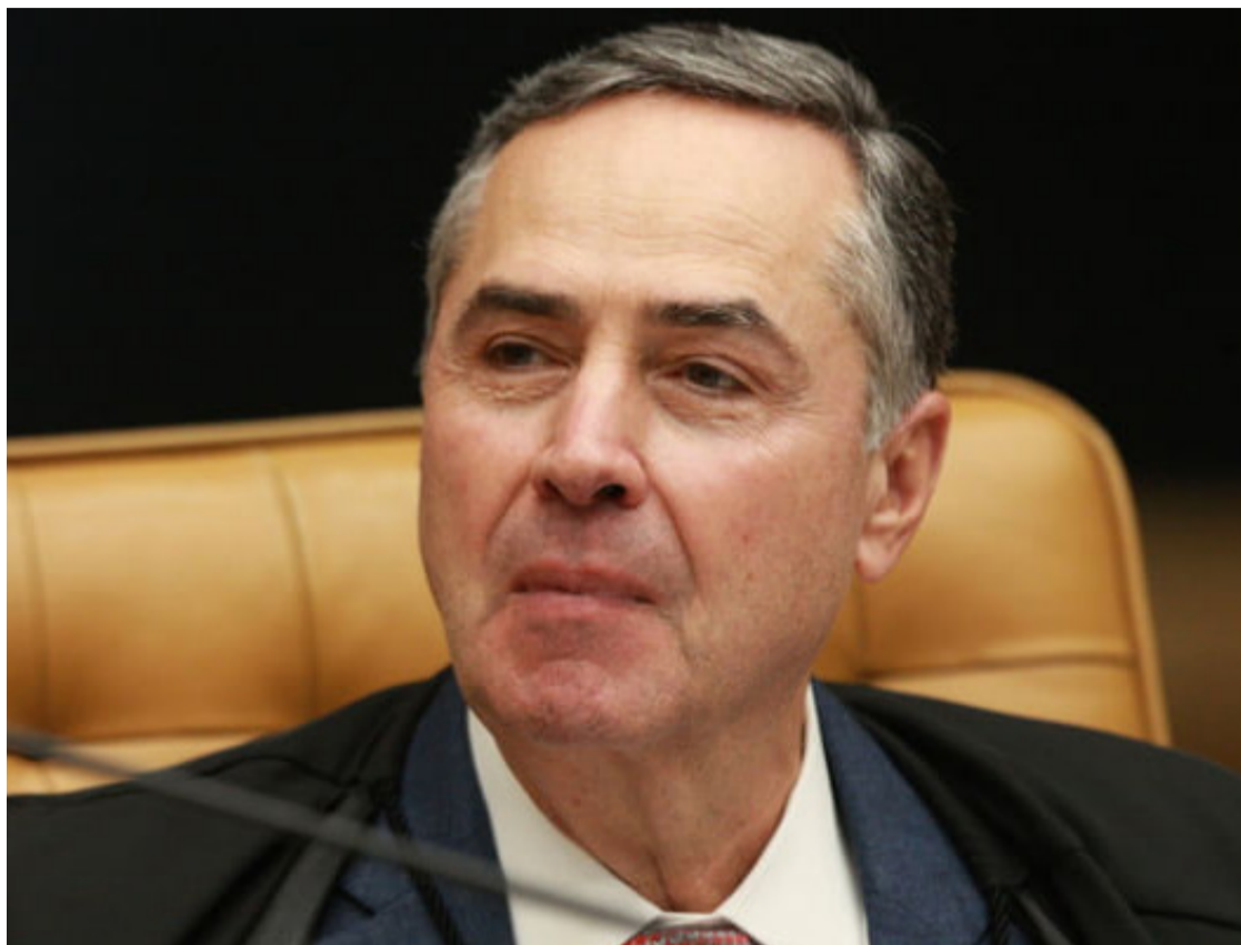
Luis Roberto Barroso: defensor do combate à corrupção

Disse, porém, que nenhuma das decisões foi tomada visando a aprovação popular da corte. Para ele, "a importância de um tribunal não pode ser