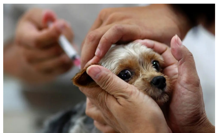
Vacinação inicia no dia 05 de agosto e encerra em 18 de outubro

Os tutores devem levar o cartão de vacinação do animal da última campanha para atualização do registro.