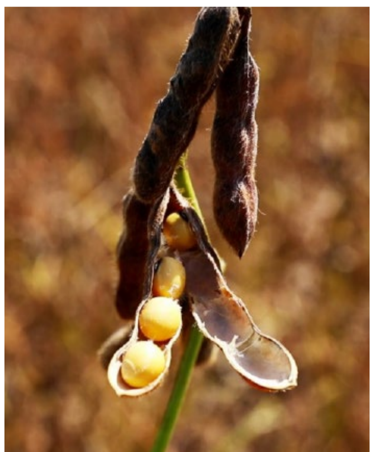
Safra 24/25 de soja de 166,6 milhões de toneladas é projetada por consultoria

No total das duas safras, o Brasil tem previsão de área para 2024/25 de 20,749 mi de ha, 2% aquém dos 21,260 mi de ha da temporada 2023/24, e produção potencial de 116,959 mi de t, estável em relação à safra atual, de 117,008 mi de t.