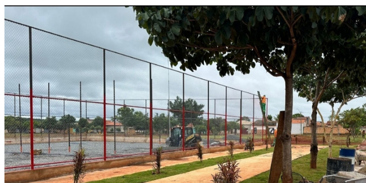
Campos e quadras públicas para prática de futebol e vôlei aumentam socialização

As quadras e campos somam-se ainda às academias ao ar livre, barras de calistenia e pistas de caminhada presentes em outras praças de Goiânia. O objetivo é oferecer o máximo de opções de esportes e lazer para a população com vistas a ampliar ainda mais os indicadores de qualidade de vida do município.