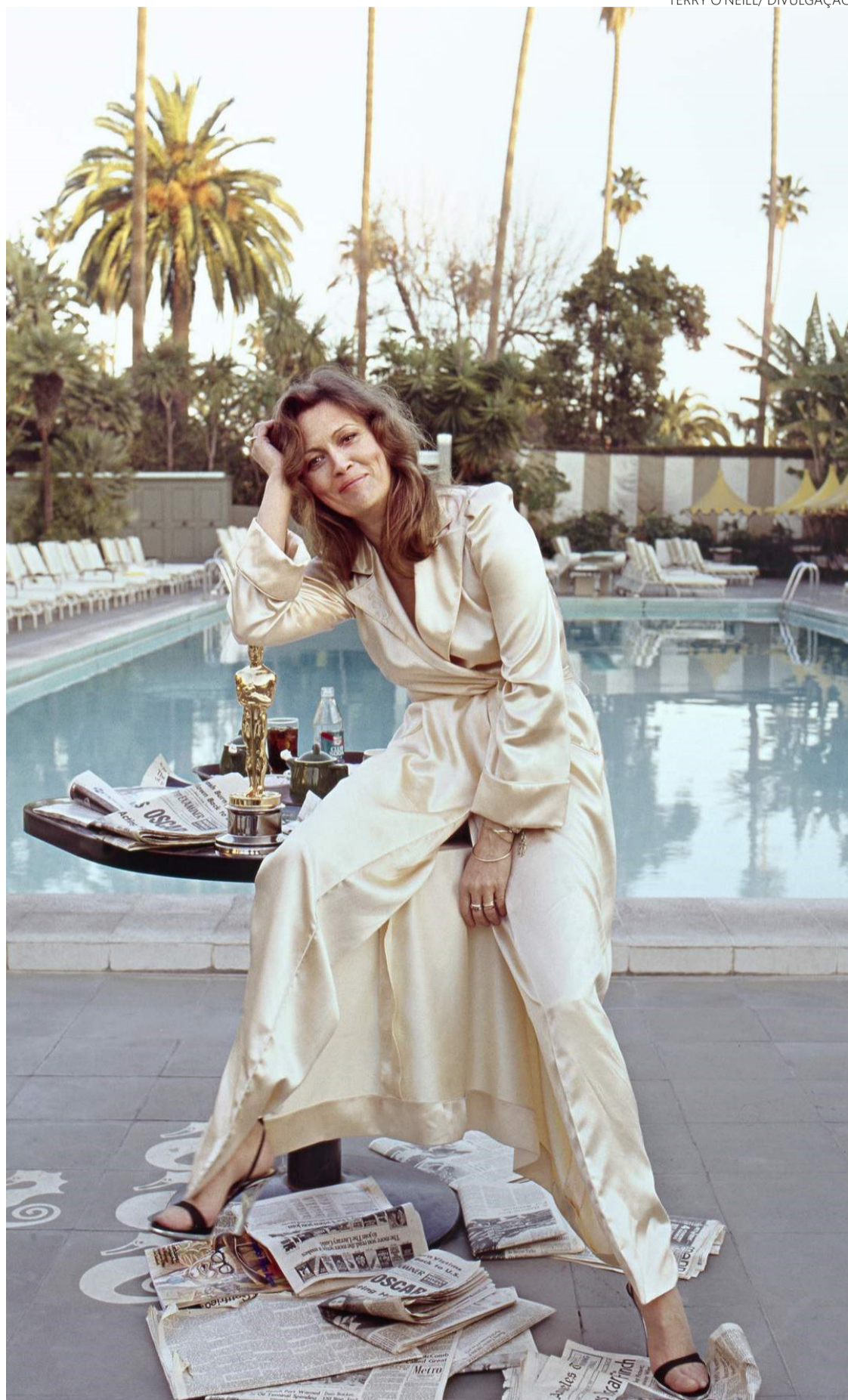
Faye Dunaway diz que acha importante o que feministas fazem

"Há uma excitação, mas também o oposto disso, que é a tristeza. Fiquei muito aliviada ao entender essa questão mental, porque isso explica tudo. Mas, ainda assim, você é responsável pelas suas atitudes, então mesmo que isso possa explicá-las, não necessariamente é uma desculpa", diz a