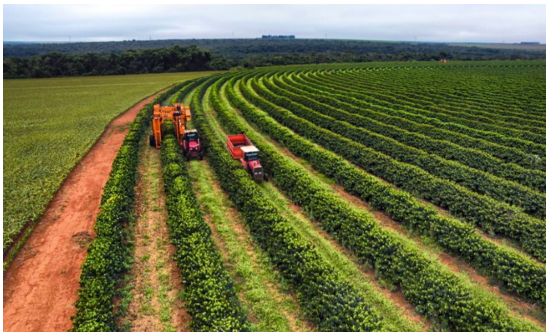
O montante do desembolso do crédito rural no Plano Safra 2023/2024 alcançou a marca inédita de R$ 400,7 bilhões, no período de julho/2023 até junho/2024 — Foto: Reprodução.

Nos financiamentos agropecuários para investimento, o Pronamp alcançou R$ 4,5 bilhões, alta de 81%. E os financiamentos para o Programa de Modernização da Frota de Tratores Agrícolas e Implementos