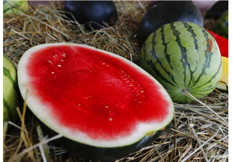
Cadastro é exigido para 17 municípios, onde produtores manifestaram à Agrodefesa o interesse em exportar os frutos

Medida visa ao monitoramento da Anastrepha grandis , uma das espécies de mosca-das-frutas, e é requisito para a exportação a países que possuem restrições quarentenárias com relação à praga