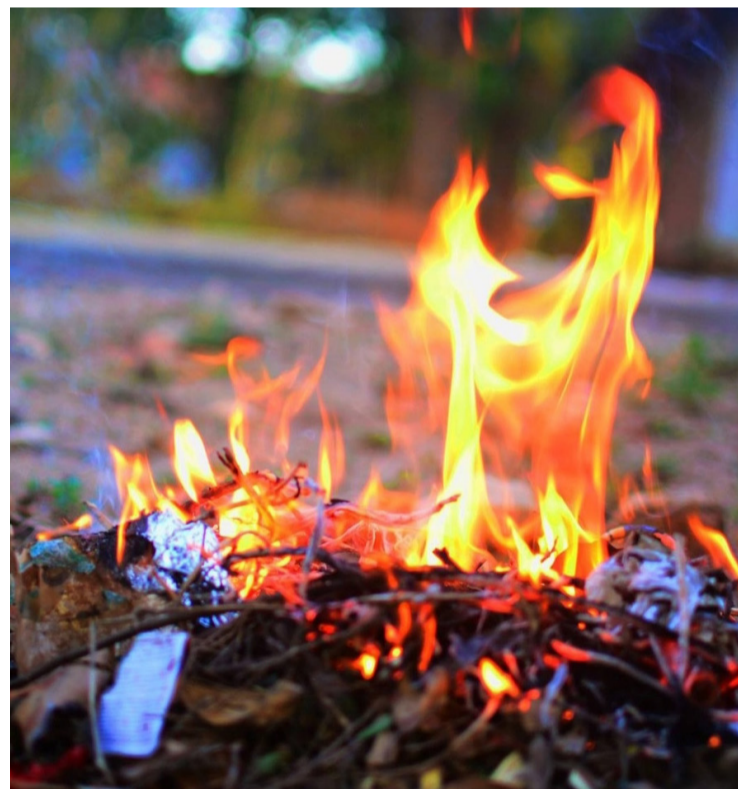
Valor da multa para quem colocar fogo nos lotes varia de R$ 144,92 a R$ 1.449,20

A primeira fase do programa de 2024 começou com um curso intensivo para os servidores operacionais da Amma, realizado no auditório da sede da agência. Os instrutores do Corpo de Bombeiros, juntamente com a equipe de Segurança do Trabalho, forneceram treinamento especializado em técnicas de combate a incêndios, incluindo o manejo seguro de extintores e estratégias de autoproteção.