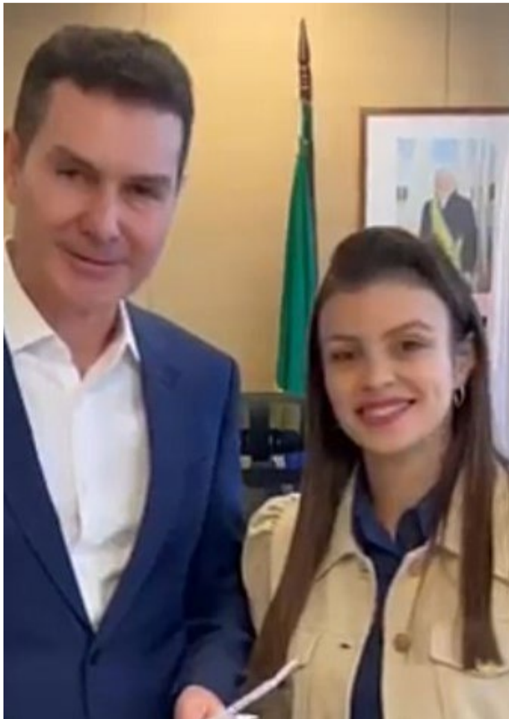
O ministro das Cidades, Jäder Filho e Marussa Boldrin anunciaram a construção de 240 unidades do Minha Casa Minha Vida em Rio Verde, nesta quarta-feira, 31/7 — Foto: Reprodução.

O ministro Jäder falou sobre a autorização e afirmou que a Caixa já está autorizada a fazer