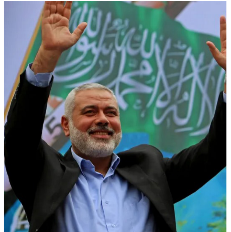
Assassinato de Ismail Haniyeh representa um golpe significativo para o Hamas e complica as já delicadas negociações de paz na região

A morte de Haniyeh ameaça desestabilizar ainda mais a região já volátil do Oriente Médio. Líderes regionais expressaram preocupações sobre as possíveis repercussões, com alguns alertando para o risco de um conflito mais amplo. O assassinato ocorreu em um momento de tensões crescentes entre Israel e Hezbollah, e pode complicar ainda mais as negociações de cessar-fogo em Gaza.