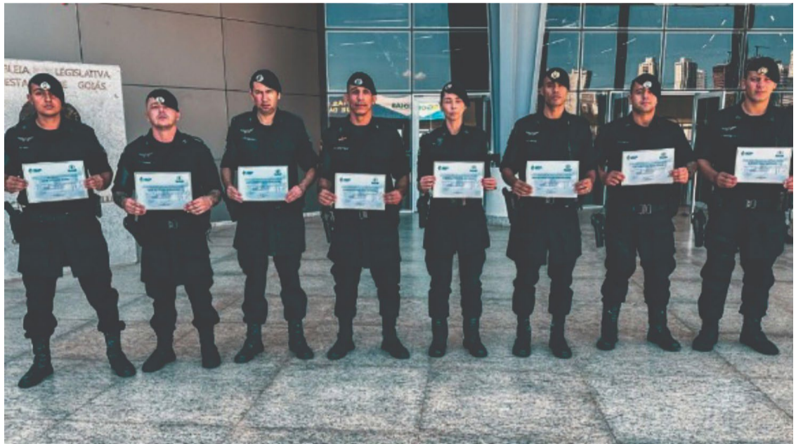
Medalha do Mérito Legislativo “Pedro Ludovico Teixeira” foi outorgada a policiais da PM, CPE e agentes da Polícia Civil lotados em Rio Verde nesta terça-feira, 30 de julho, em Goiânia

Este prêmio é um reflexo do incansável trabalho desses profissionais, que enfrentam desafios e perigos diários para proteger a sociedade.